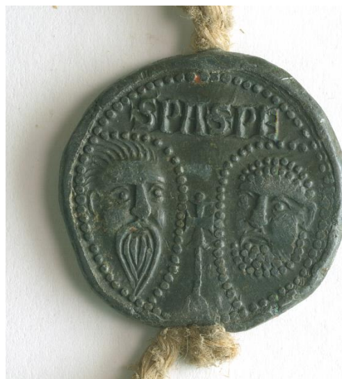
Bulla ołowiana papieża Klemensa VI z 1342 r.

Bulle pisane były ozdobną łaciną na grubym pergaminie